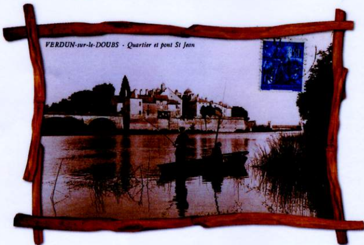
VERDUN-sur-le-DOUBS - Quartier et pont St Jean