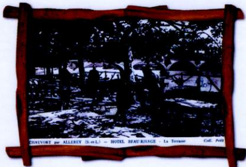
CHAUVOGT par ALLERREY (S.-et-L.) - HOTEL BEAU RIVAGE - La Terrasse